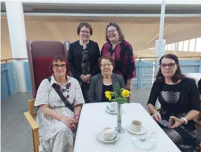
Puurtilan Martat ry toi meille onnittelutervehdyksen