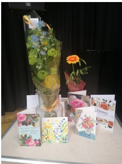
Onnea 20 -vuotiaalle Varkauden Seudun Omaishoitajat ry:lle